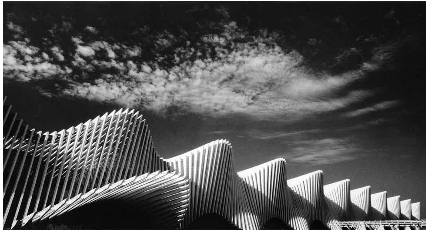
Stanislao Farri, La stazione ferroviaria AV Mediopadana di Santiago Calatrava, Reggio Emilia, 2013

Sala Pampari – Ordine dei Medici di Reggio Emilia Sabato 29 febbraio 2020